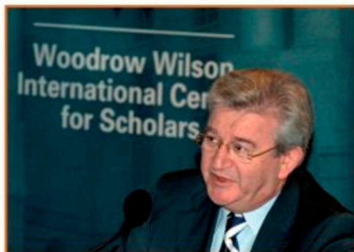
Ο Υφυπουργός Οικονομίας & Οικονομικών κ. Χρήστος Φώλιας ως ομιλητής στο Διεθνές Ίδρυμα Γούντροου Γούλσον

Σε όλες τις συναντήσεις και τις επαφές που είχε ο κ. Φώλιας δεν έχανε την ευκαιρία να υπογραμμίσει το ρόλο της Ελλάδας ως